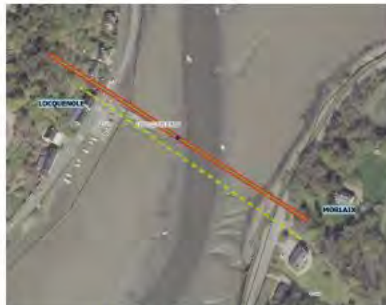
----- Nouvelle proposition