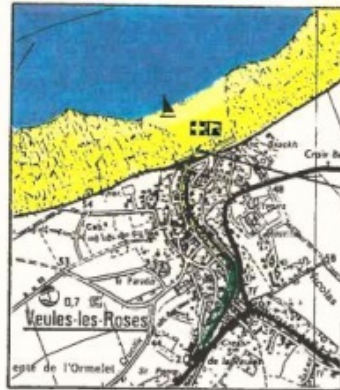
IGN - 1908 sud - 1 / 25000

LTM : texte non trouvé ; par défaut, considérée comme confondue avec la LSE