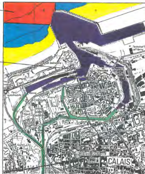
IGN - 2202 sud - 1 / 25000

exercice de la pêche dans le port - arrêté préfectoral du 1/10/1947, modifié 12/05/1960