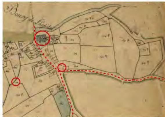
Extrait cadastre Napoléonien – Hôpital-Camfrout (1825)