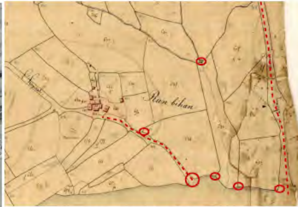
Extrait cadastre Napoléonien – Logonna-Daoulas (1827)