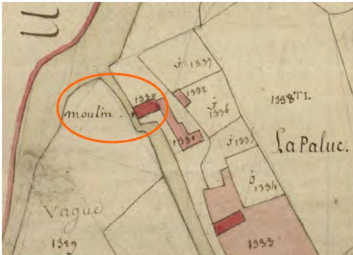
Extrait cadastre Napoléonien (1847)