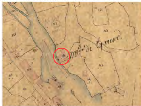
Extrait cadastre Napoléonien (1832)