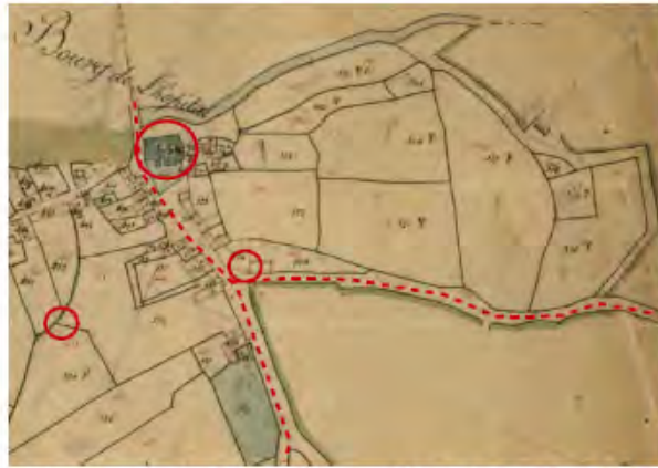
Extrait cadastre Napoléonien – Hôpital-Camfrout (1825)