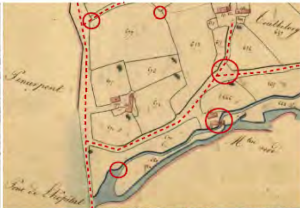
Extrait cadastre Napoléonien – Irvillac(1826)