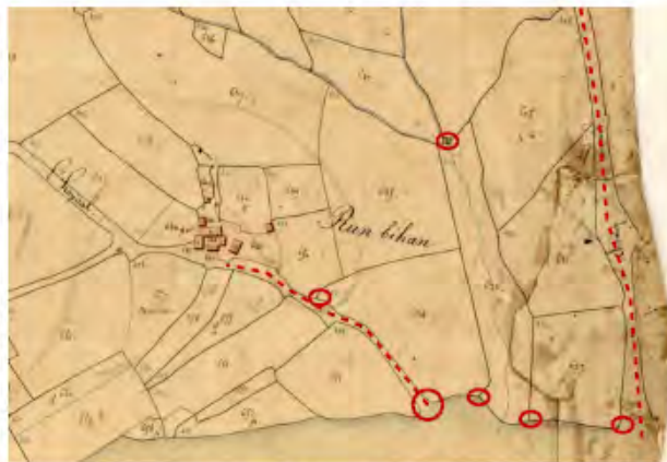
Extrait cadastre Napoléonien – Logonna-Daoulas (1827)