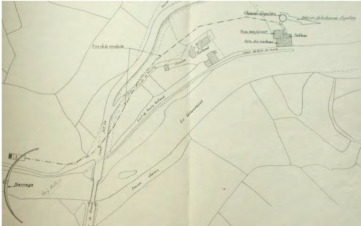
Fig. 1. Plan d'ensemble des ouvrages de la chute du Pont-Rolland, 30 mars 1933 (AD 22)