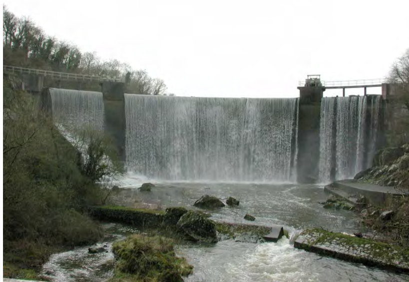
Fig. 3. Vue de face. On distingue les vestiges du déversoir de l'ancien moulin Rolland