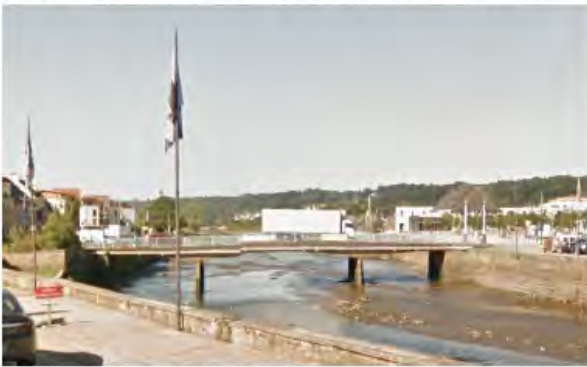
Pont en aval du pont de Rohan