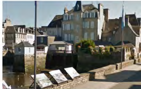
Pont de Rohan

LIM de la DDTM29 manque de précision : à repositionner à l'identique de la LIM du SHOM