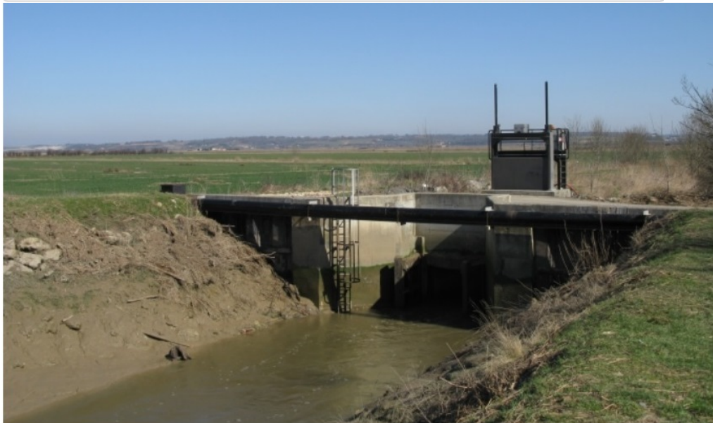
Chenal et porte éclusière du Port de C o nac, canal du Centre - La porte du canal du Centre, vue en aval.