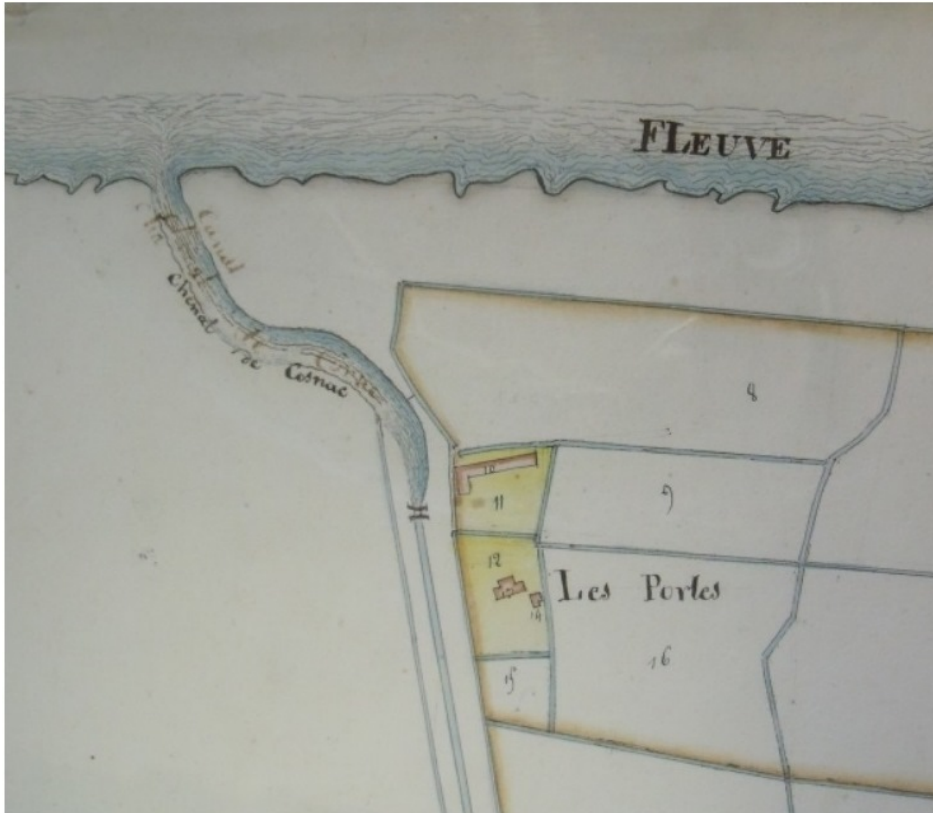
Chenal et porte éclusière du Port de C o nac, canal du Centre - Le chenal, rive droite, sur le plan cadastral de 1828.

Recherche complémentaire (internet) : Lien