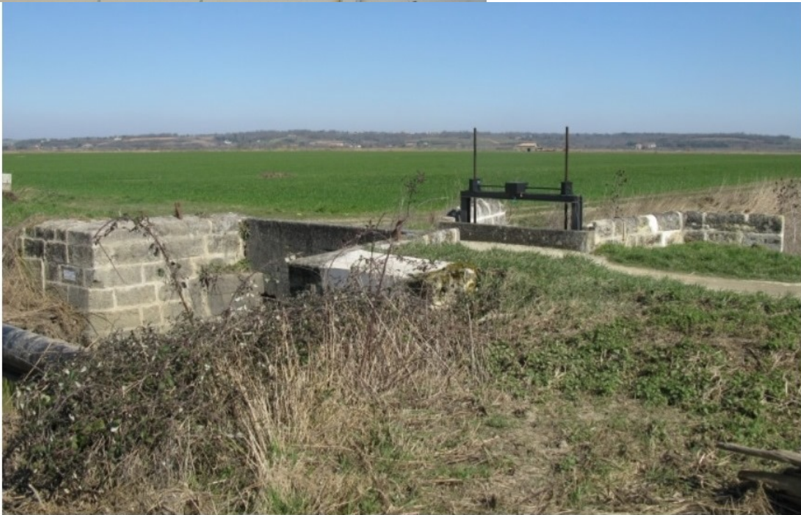
Chenal et porte éclusière du Port de Charron, canal de Charron - La porte de Charron vue depuis le sud-ouest, en aval.